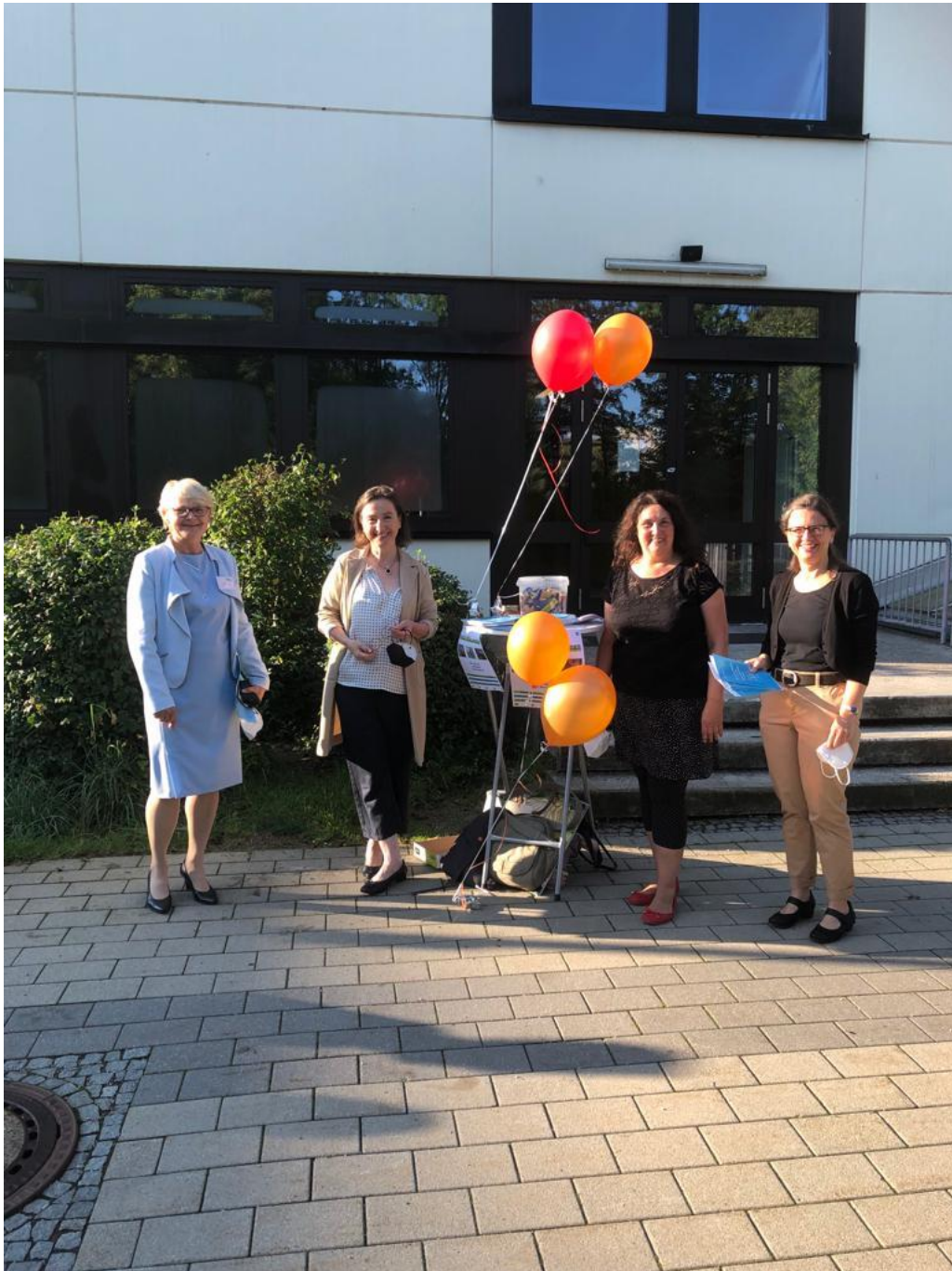
Begrüßung der 5. Klassen