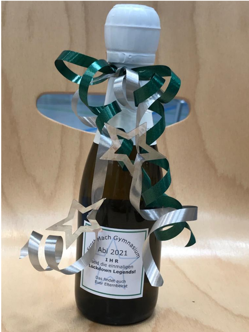
Zur Verabschiedung der AbiturientInnen

Wo immer wir die Herausforderungen unserer Zeit mit Verstand und Herz annehmen, werden wir die notwendige Kraft finden. (Richard von Weizsäcker