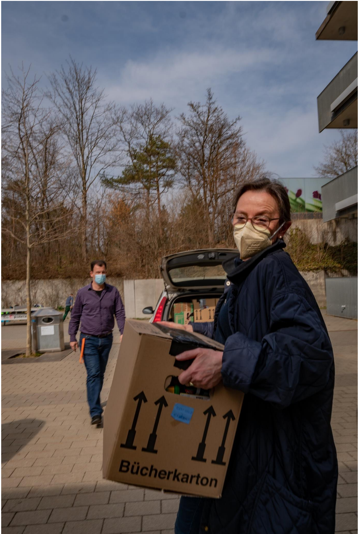
Transporthelfer bei der SMV-Aktion für die Ukraine