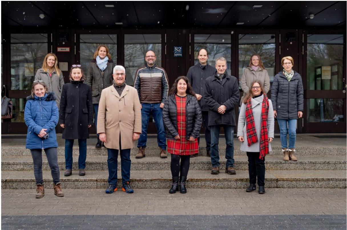
Der Neue Elternbeirat 2021-23 ☺