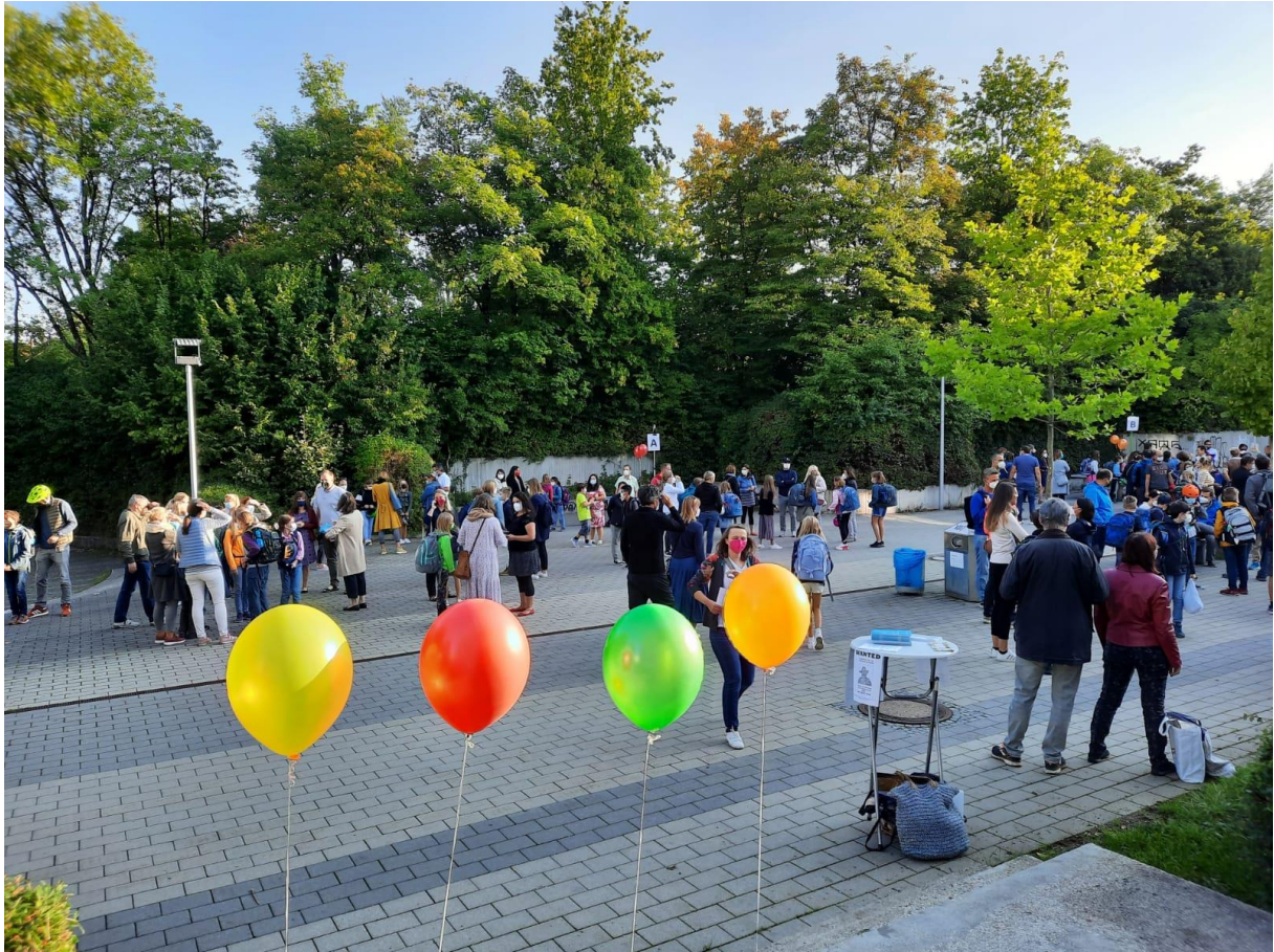
Begrüßung der 5. Klassen bei strahlendem Sonnenschein